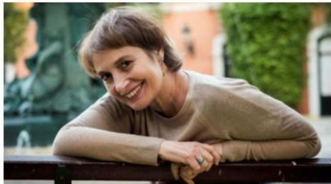
Llega a los teatros la verdadera historia de "La canción de Ipanema"