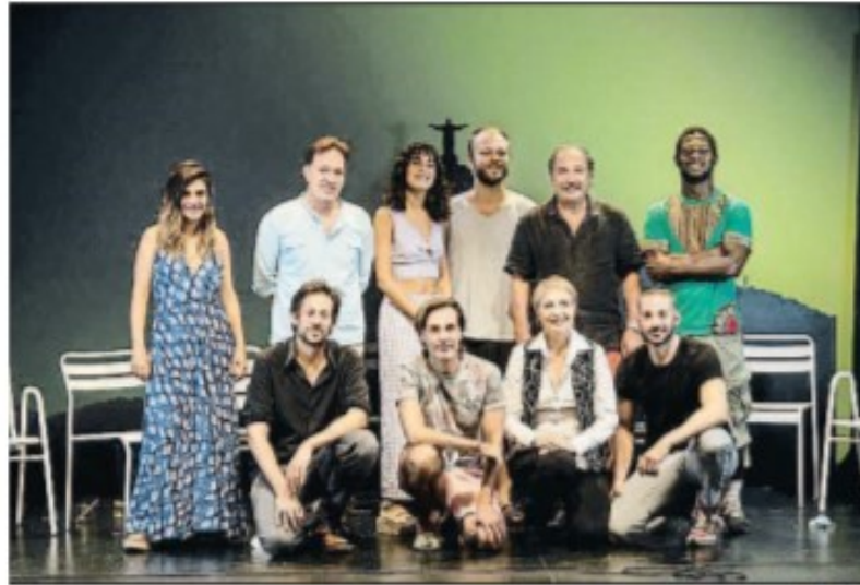
El equipo de La canción de Ipanema durante la rueda de prensa ayer en el Aquitània Teatre

La veterana intérprete llega a este proyecto muy ilusionada y por dos motivos: "primero porque es un musical y nunca se había hecho nada aquí sobre la bossa nova y luego porque es un canto a la mujer, al amor, que es otro de los mensajes que me mueven". La pieza teatral hace un recorrido por las canciones más importantes que se crearon durante los nueve meses antes de que la bossa nova pasara a convertirse en un fenómeno musical internacional, entre